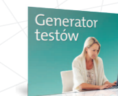
Twórz sprawdziany do lekcji