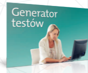
Twórz sprawdziany do lekcji