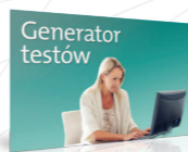
Twórz sprawdziany do lekcji