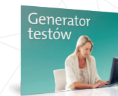
Twórz sprawdziany do lekcji