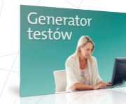
Twórz sprawdziany do lekcji