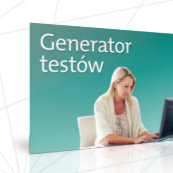
Twórz sprawdziany do lekcji