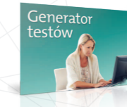
Twórz sprawdziany do lekcji