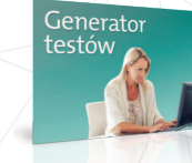
Twórz sprawdziany do lekcji