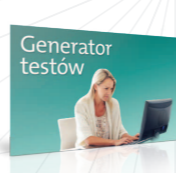
Twórz sprawdziany do lekcji